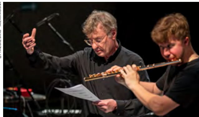
© PRAŽSKÉ JARO - MILAN MOŠNA