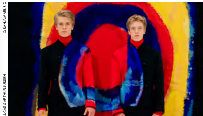
LUCAS &amp; ARTHUR JUSSEN