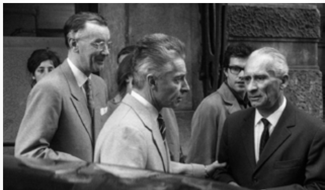
HERBERT VON KARAJAN A KAREL ANCERL NA PRAŽSKÉM JARU 1963