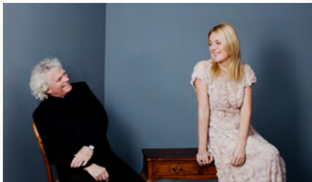
SIR SIMON RATTLE, MAGDALENA KOŽENÁ