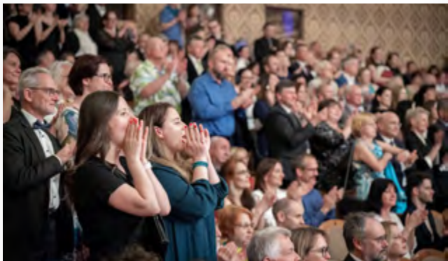
© PRAŽSKÉ JARO – IVAN MALÝ