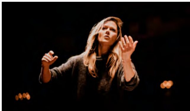
BARBARA HANNIGAN