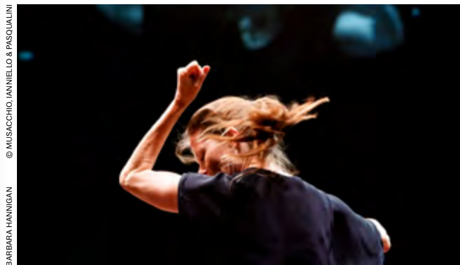
BARBARA HANNIGAN